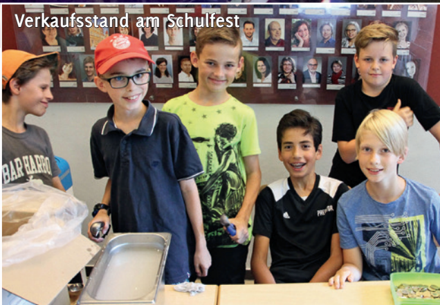
Verkaufsstand am Schulfest