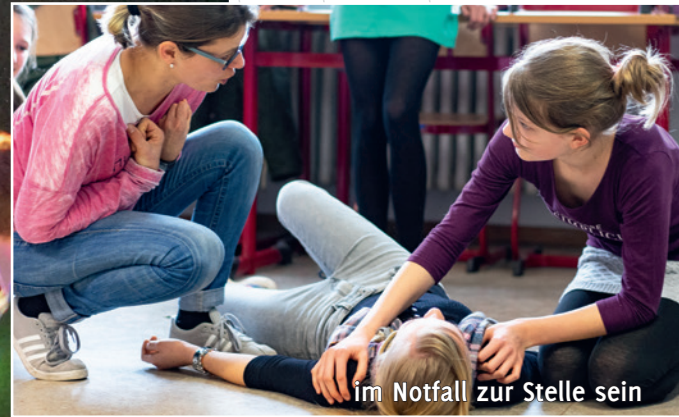
im Notfall zur Stelle sein