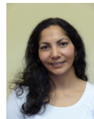
Dari Urdu Neilam Elmadi